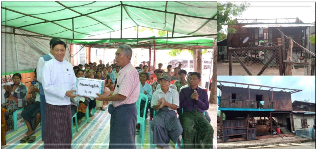
၂၀၂၄ ခုနှစ်၊ မေလ ၂ ရက်