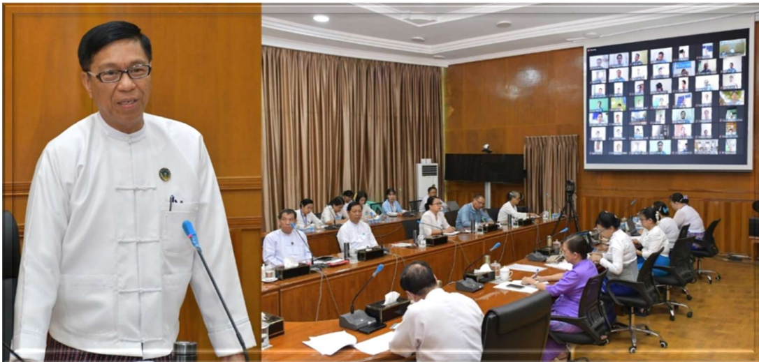
၂၀၂၄ ခုနှစ်၊ မေလ ၂ ရက်