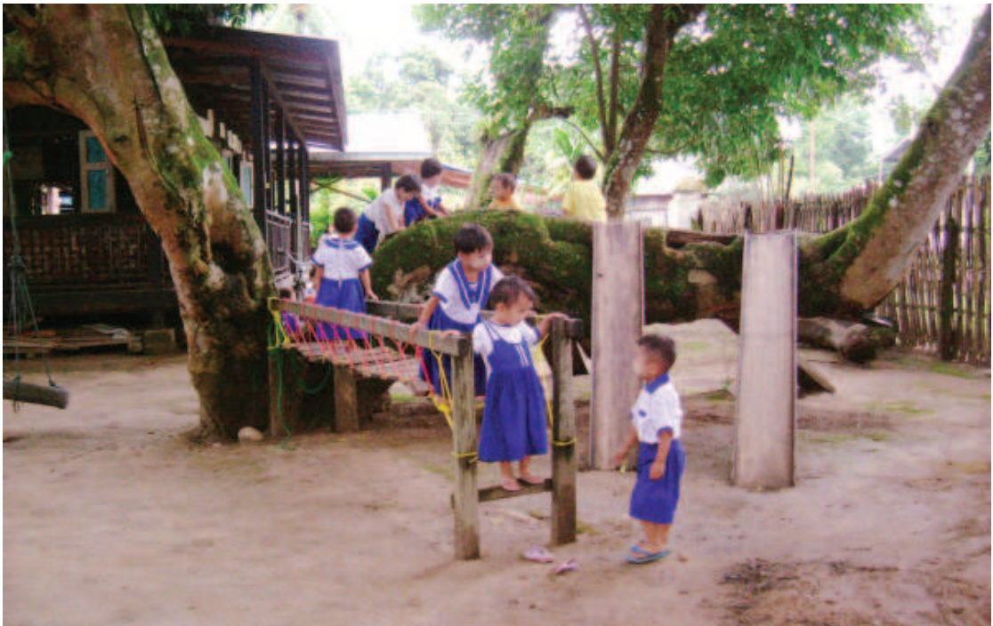
ရပ်ရွာအဆင့် ECCD ကော်မတီများသည် မူကြိုနှင့် အခြား ECCD ဝန်ဆောင်မှုများ ထူထောင်ရန်အတွက် အလွန်အရေးပါသည်

၄၀၅။ ရပ်ရွာအဆင့် ECCD ကော်မတီများသည် ရပ်ရွာအဆင့် ECCD အခြေအနေကို လေ့လာ ဆန်းစစ်မှု ပြုလုပ်ပါမည်။ ရပ်ရွာတွင် ECCD ဆိုင်ရာ မူဝါဒအကောင်အထည်ဖော်ရေးကို ကြည့်ရှု လေ့လာသုံးသပ်ပါမည်။ ECCD ဆိုင်ရာ လုပ်ငန်းအားလုံးတွင် အားလုံးပါဝင်နိုင်ရေးကို