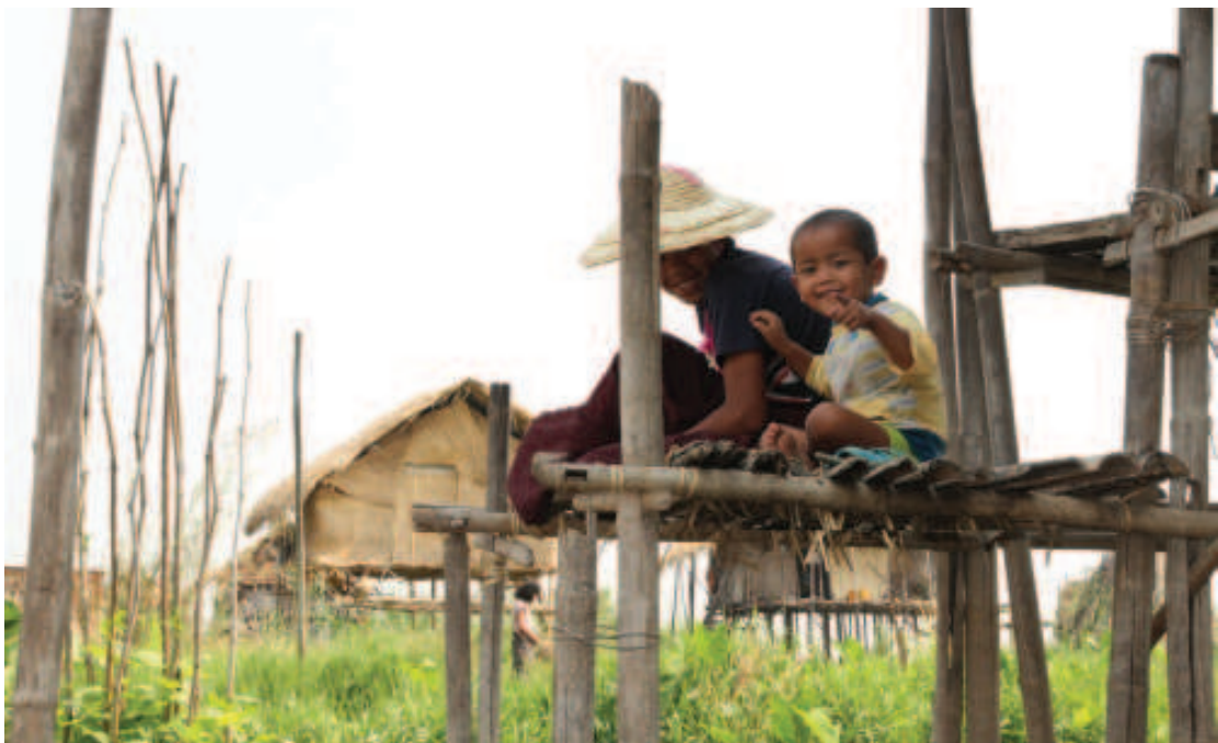
ဘေးကင်းလုံခြုံမှုမရှိသောအခြေအနေရှိကလေးများ အန္တရာယ်ကင်းစွာ ဖွံ့ဖြိုးတိုးတက်စေရန် မူကြိုဝန်ဆောင်မှုလုပ်ငန်းများလိုအပ်သည်