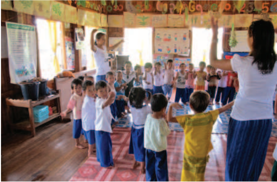
စုပေါင်းလှုပ်ရှားချိန်၊ မူကြိုကျောင်း၊ ညောင်ရွှေမြို့