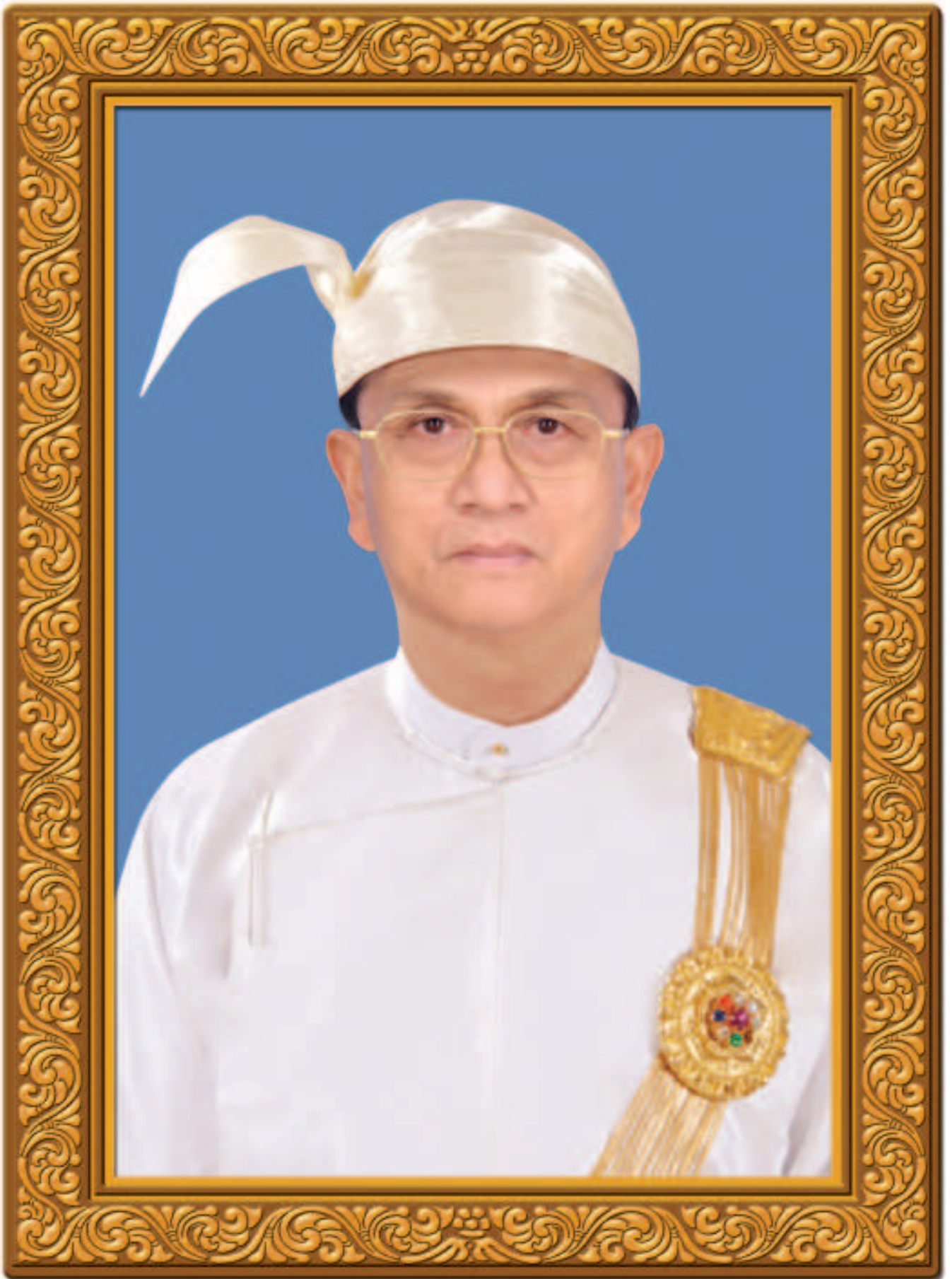
နိုင်ငံတော်သမ္မတ အဂ္ဂမဟာသရေစည်သူ၊ အဂ္ဂမဟာသီရိသုဓမ္မ ဦးသိန်းစိန်