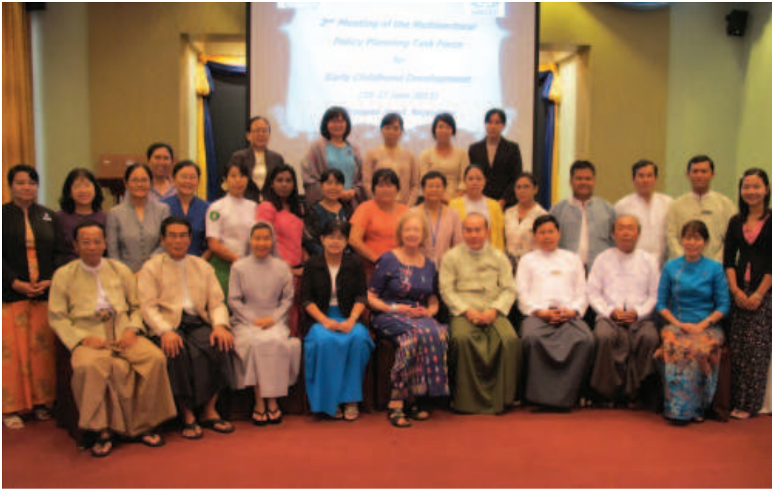
ကဏ္ဍပေါင်းစုံပါဝင်သော ECCD မူဝါဒရေးဆွဲရေးလုပ်ငန်းအဖွဲ့