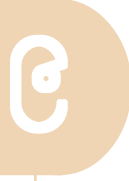
ကဏ္ဍပေါင်းစုံပါဝင်သော ECCD မူဝါဒရေးဆွဲရေးဦးဆောင်ကော်မတီ