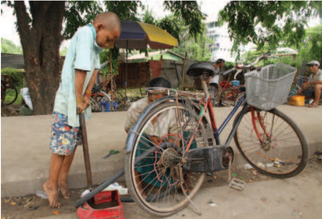
ကလေးများအားလုံး ပညာသင်ခွင့်ရရှိရန် မိသားစုပံ့ပိုးမှုအစီအစဉ်များ မြှင့်တင်ရန်အရေးကြီးသည်