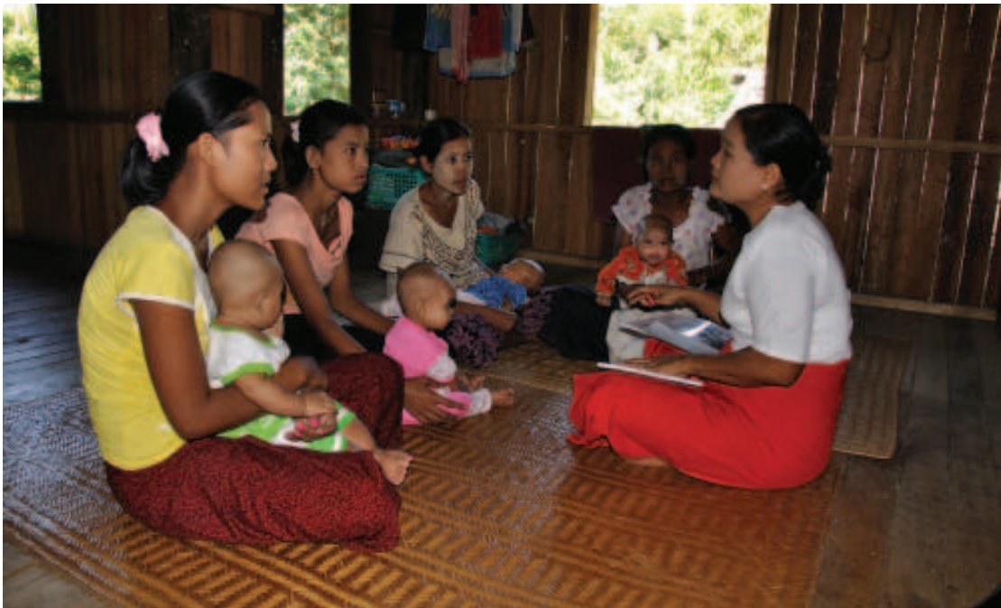
အိမ်တိုင်ရာရောက်မိဘပညာပေးဆွေးနွေးခြင်းဖြင့် မိသားစုအားလုံးကို ပံ့ပိုးကူညီခြင်း