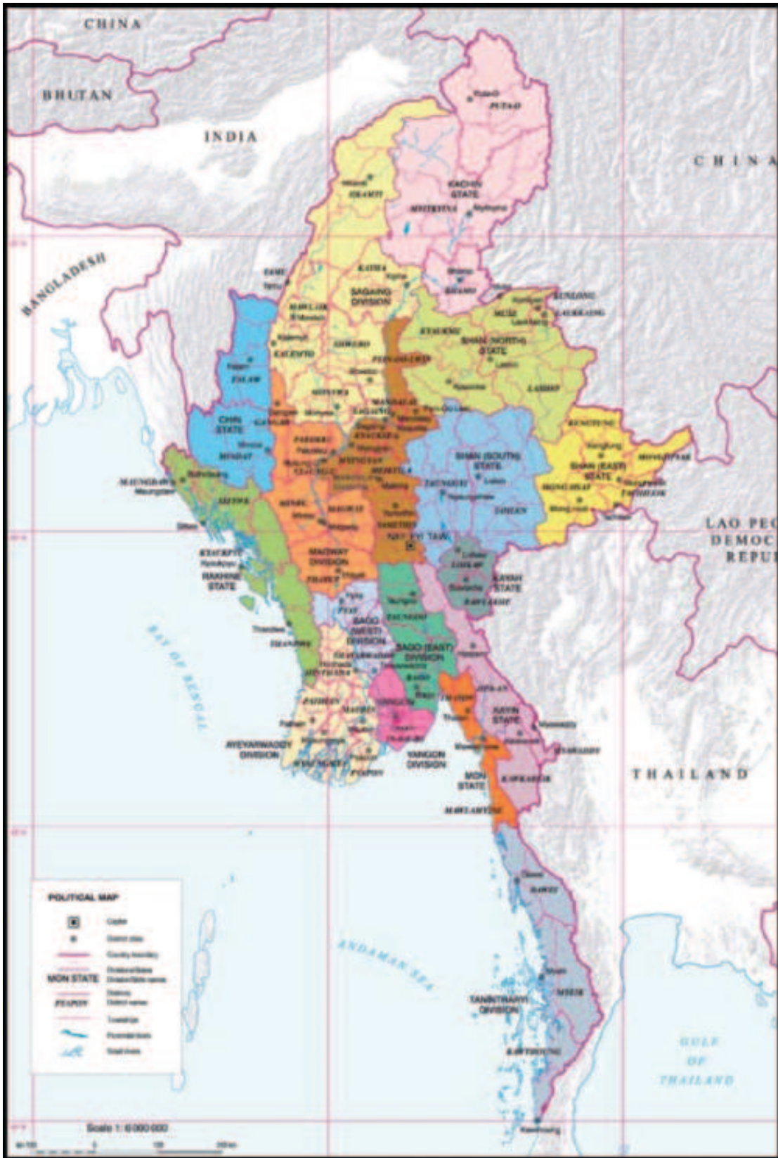
ပြည်ထောင်စုသမ္မတမြန်မာနိုင်ငံတော်မြေပုံ