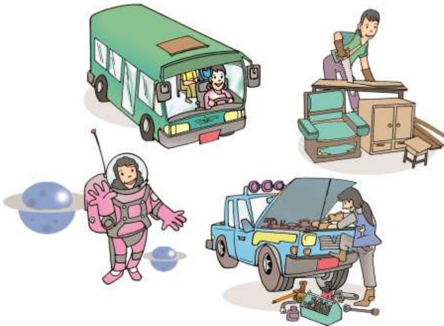
(၁) အမျိုးသမီးများနဲ့ အသက်မွေးဝမ်းကျောင်းမှု