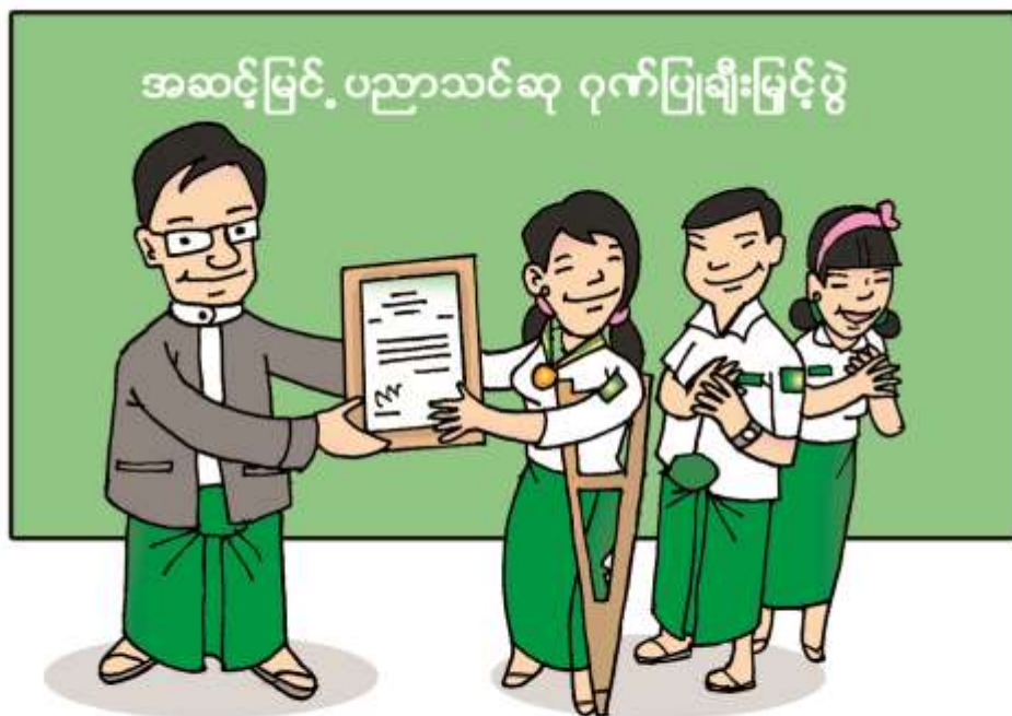
(၂) အမျိုးသမီးများနှင့် ပညာရေး၊လေ့ကျင့်သင်ကြားရေး