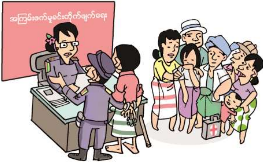
(၄) အမျိုးသမီးများအပေါ်အကြမ်းဖက်မှု

ရည်ရွယ်ချက်ဦးတည်ချက်နှင့်လုပ်ငန်းအစီအစဉ်များ