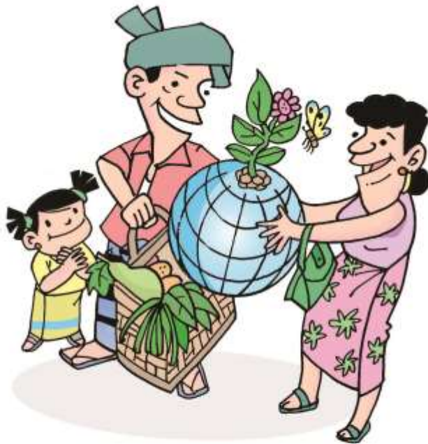
(၁၁) အမျိုးသမီးများနှင့် သဘာဝပတ်ဝန်းကျင်