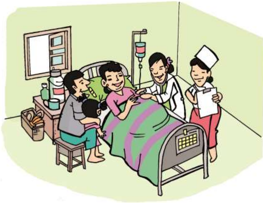
(၃) အမျိုးသမီးများနှင့် ကျန်းမာရေး