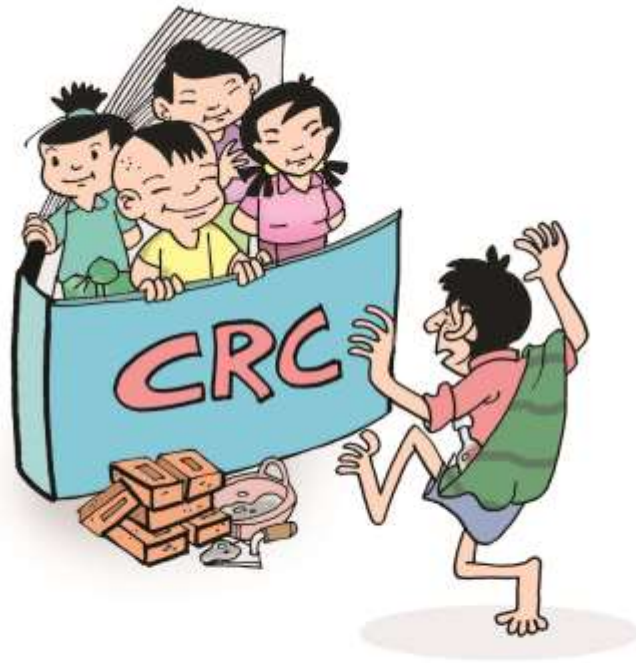
(၁၂) အမျိုးသမီးငယ်ရွယ်များ

ရည်ရွယ်ချက်ဦးတည်ချက်နှင့်လုပ်ငန်းစဉ်များ