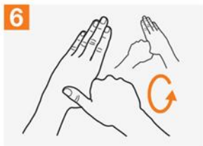
6 ဘယ်ဘက်လက်မကို ညာဘက်လက်ဖဝါးထဲတွင် နှပ်၍ လှည့်ပြီး ပွတ်ပါ။ နောက်တစ်ဘက်ကိုလည်း ထိုနည်းအတိုင်း တစ်ဖန် ပြုလုပ်ပါ။