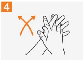
4 လက်ဖောင်းချင်းယှက်လျက် လက်ဖဝါး အချင်းချင်း ပွတ်ပါ။