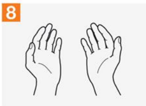
8 သင့်လက်များ မြှောက်နေသည့်အပြင်အတိုင်း လက်တွေ သန့်စင်သွားပါပြီ။