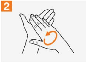
2 လက်ဖဝါးအချင်းချင်း ပွတ်တိုက်ပါ။