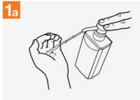
1a လက်ခုပ်ထဲသို့ လက်တစ်ဖဝါးစာ လက်ဆေးရည်ကို ထည့်ပါ။

🕒 လက်ဆေး/ပွတ်တိုက်သော ကြာချိန်စုစုပေါင်း ၂၀-၃၀ စက္ကန့်