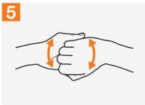
5 လက်ဖောင်းများ အစွန်းချင်းချိပ်နေသည့် အနေအထားဖြင့် လက်ဖောင်းများ၏ တဝှမ်းဘက်ကို အခြားလက်ဖဝါး တစ်ဘက်တွင် ထည့်၍ပွတ်ပါ။