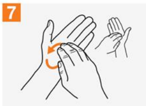
7 ညာဘက်လက်ဖောင်းထိပ်များကို ငြိမ့် ဝဲဘက်လက်ဖဝါးပေါ်တွင် တစ်ဖန် အနောက်လှည့်ပြီး ပွတ်ပါ။ ထိုနည်းအတိုင်း အခြားတစ်ဘက်ကိုလည်း ပြုလုပ်ပါ။