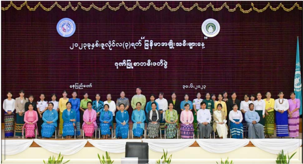
၂၀၂၃ ခုနှစ်၊ ဇွန်လ ၃၀ ရက်နေ့