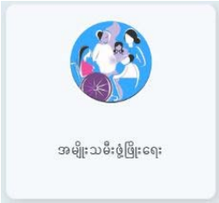
အမျိုးသမီးခွဲခြားရေး

အစည်းအဝေးတွင် လူမှုဝန်ထမ်းဦးစီးဌာန၊ ညွှန်ကြားရေးမှူးက (CEDAW) ဆဋ္ဌမ အကြိမ်မြောက် အစီရင်ခံစာ ရေးသားရေးနှင့် ပတ်သက်၍ ရှင်းလင်းတင်ပြခဲ့ပါသည်။ တက်ရောက် လာသည့် ကိုယ်စားလှယ်များက ဆဋ္ဌမအကြိမ်မြောက် အစီရင်ခံစာ Second draft (မူကြမ်း) အပေါ် အကြံပြုဆွေးနွေးခဲ့ကြကာ အစည်းအဝေးအား ညနေ (၁၇:၀၀)နာရီတွင် ရုတ်သိမ်းခဲ့ပါသည်။