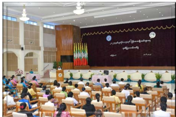
ဆက်လက်ပြီး စာတမ်းဖတ်ပွဲအခမ်းအနားအား

ကော်မတီဝင်များ၊ ဌာနဆိုင်ရာ အသီးသီး၏ Gender Focal Person များနှင့် ဖိတ်ကြားထားသူများ တက်ရောက်ခဲ့ကြပါသည်။