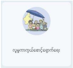
လူမှုကာကွယ်စောင့်ရှောက်ရေး