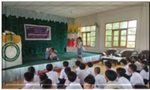
(၉-၆-၂၀၂၃)ရက်နေ့တွင် တနင်္သာရီတိုင်းဒေသကြီး ဦးစီးမှူးရုံးမှ တာဝန်ရှိသူများသည် ရင်းနှီးမြှုပ်နှံမှုနှင့်ကုမ္ပဏီ