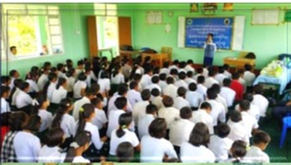
(၈-၆-၂၀၂၃)ရက်နေ့တွင် တနင်္သာရီတိုင်းဒေသကြီး

ဦးစီးမှူးရုံးမှ တာဝန်ရှိသူများသည် ထားဝယ်ခရိုင်၊ ထားဝယ်မြို့နယ်ရှိ အ.ထ.က(၁) အခြေခံအထက်တန်း ကျောင်းရှိ ဆရာ/ဆရာမနှင့် ကျောင်းသား/ကျောင်းသူ အင်အား(၃၀၀)ဦးခန့်ဖြင့် သဘာဝဘေးအန္တရာယ်ဆိုင်ရာ အသိပညာပေးဟောပြောခြင်းများနှင့် လက်ကမ်းစာစောင် များ ဖြန့်ဝေဆောင်ရွက်ခဲ့ပါသည်။