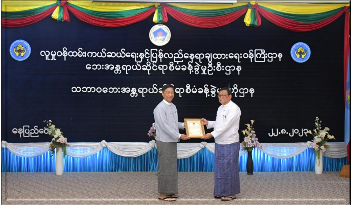
၂၀၂၃ ခုနှစ်၊ ဩဂုတ်လ ၂၂ ရက်နေ့