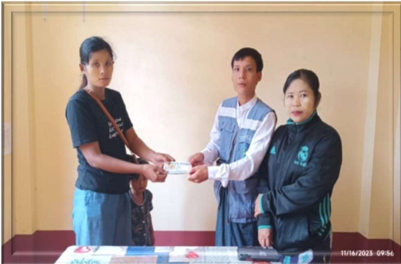
(၁၄-၁၁-၂၀၂၃) ရက်နေ့တွင် တနင်္သာရီတိုင်း ဒေသကြီး၊ မြိတ်ခရိုင်၊ ကျွန်းစုမြို့နယ်၊ မအိုင်ကျေးရွာ အုပ်စု၊ ပထက်ကျေးရွာ၌ မိုးကြိုးထိမှန်၍ လူ(၁)ဦး သေဆုံး

ကာ သေဆုံးထောက်ပံ့ငွေကျပ် (၃၀၀,၀၀၀/-) အား (၁၅-၁၁-၂၀၂၃) ရက်နေ့တွင် မြိတ်ခရိုင်ဦးစီးမှူးရုံးမှ သွားရောက်ထောက်ပံ့ခဲ့ပါသည်။