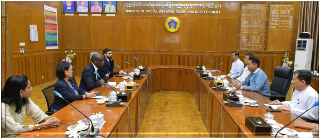
၂၀၂၃ခုနှစ်၊ နိုဝင်ဘာလ ၉ ရက်