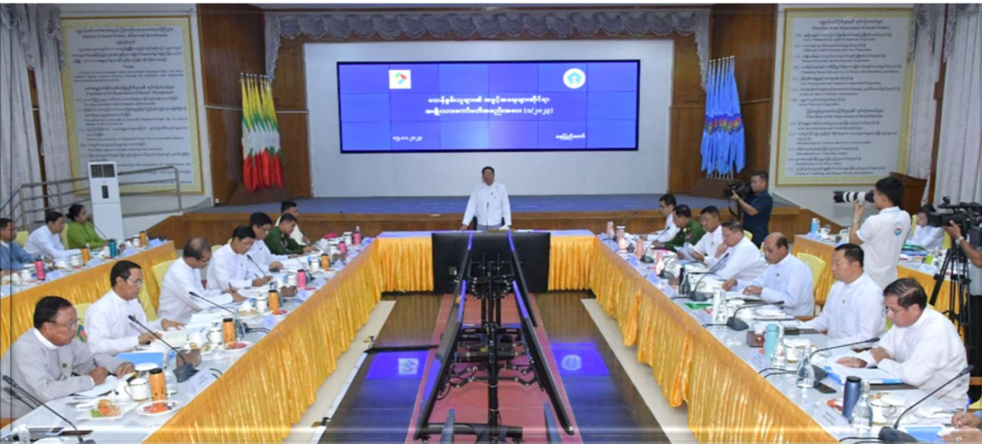
၂၀၂၃ခုနှစ်၊ နိုဝင်ဘာလ ၁၅ ရက်