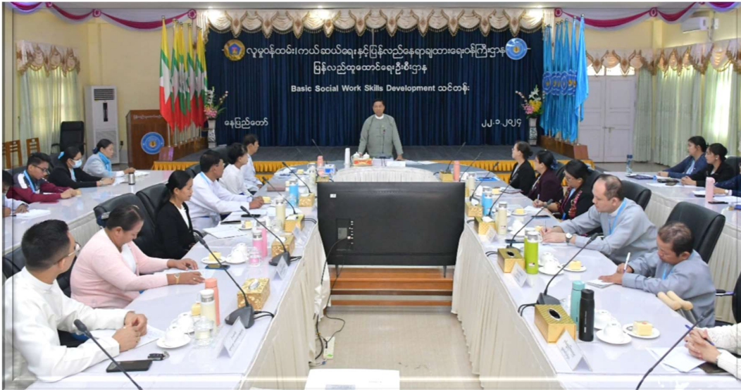
၂၀၂၄ခုနှစ်၊ ဇန်နဝါရီလ ၂၂ ရက်