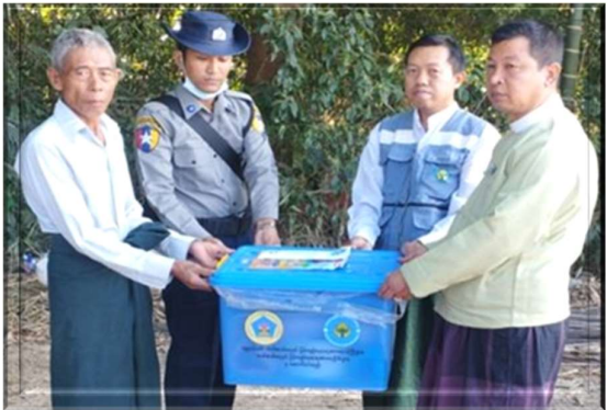
(၉-၁-၂၀၂၄)ရက်နေ့တွင် ဧရာဝတီတိုင်းဒေသကြီး၊

မအူပင်ခရိုင်၊ မအူပင်မြို့နယ်၊ လေးအိမ်စု ကျေးရွာအုပ်စု၊ ကုက္ကိုလ်စုကျေးရွာ၌ ကမ်းပြိုဘေးကြောင့် ပြိုကျပျက်စီးလူနေအိမ်(၂)လုံးအတွက် အိမ်ဆောက်ပစ္စည်းဖိုးထောက်ပံ့ငွေ (၂၀၀,၀၀၀/-)၊ ဘေးသင့်လူဦးရေ (၁၂) ဦးတို့ အတွက် ဆန်ရိက္ခာဖိုး ထောက်ပံ့ငွေကျပ် (၂၅,၂၀၀/-) နှင့် ကယ်ဆယ်ရေးပစ္စည်း(၁၆)မျိုးတို့ကို(၉-၁-၂၀၂၄)ရက်နေ့တွင် မအူပင်ခရိုင်ဦးစီးမှူးရုံးမှ သွားရောက်ထောက်ပံ့ခဲ့ပါသည်။